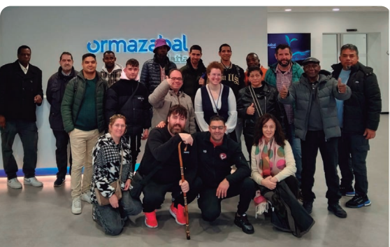
El grupo del taller Ariz de Caritas Bizkaia visitó la planta de Ormazabal en Igorre, referente en el desarrollo de soluciones tecnológicas para la distribución eléctrica. ¡Gracias por la acogida!

Ibilbidean zehar bertatik bertara ezagutu genituen Gandarias Etxea, Kidenda, Kooperera Alde Zaharra, Egun On Etxea, Hontza, Hargindegi, Indautxu Enplegua, III-VII BBT eta Haran Zentroan egiten den lana, taldeen lanera eta artatutako pertsonen errealitatera hurbilduz.