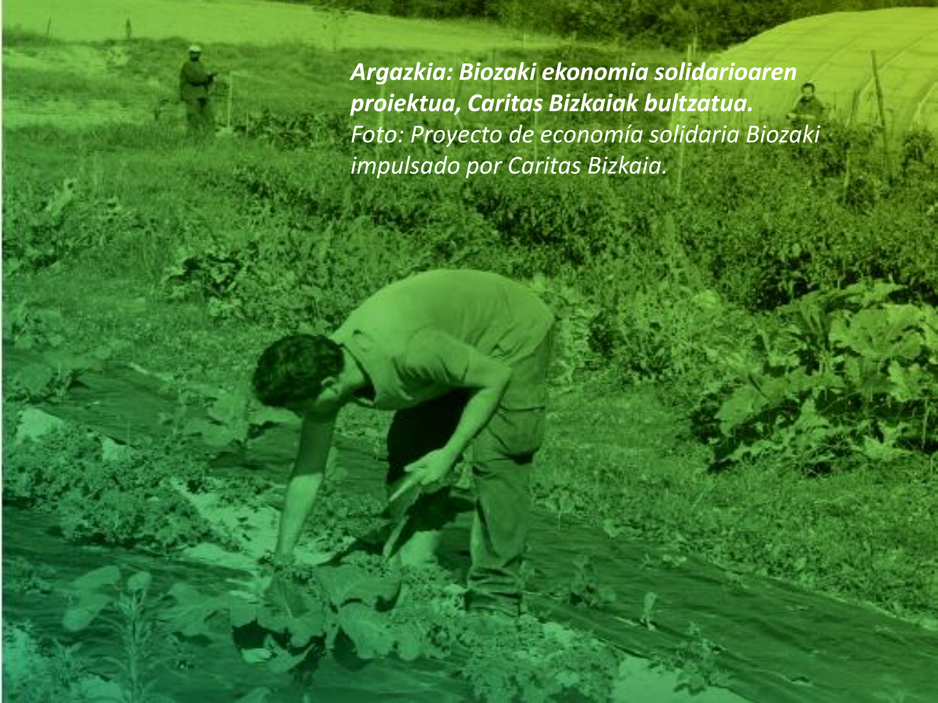
Foto: Proyecto de economía solidaria Biozaki impulsado por Caritas Bizkaia.

Argazkia: Biozaki ekonomia solidarioaren proiektua, Caritas Bizkaiak bultzatua.