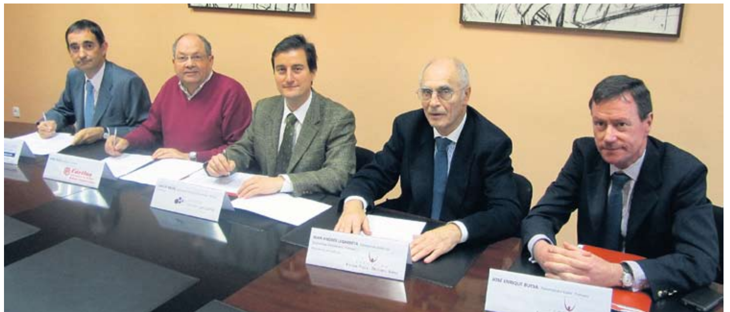
Entre 2010 y 2012 GizaLAN ha financiado 88 nuevos puestos de trabajo.

El trabajo de este centenar de personas contratadas ha permitido