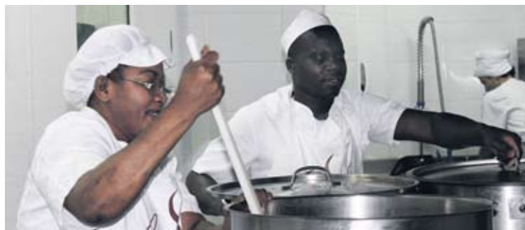
11 langilek osatzen dute lantaldea, eta horietatik 8 laneratzeko prozesuan daude.

► Más de 400 menús diarios, es decir, por encima de los 150.000 menús al año para los comedores sociales de Caritas, así como cualquier otro servicio de catering integral: ‘coffee-break’, lunch, cocktails, comidas populares y eventos, tanto para particulares como para entidades sociales y empresas. Todo esto es lo que ofrece la empresa de inserción Lapiko Catering. Nacida en noviembre de 2011, dentro del seno de Caritas Bizkaia, pretende dar respuesta a la demanda de los menús diarios de los comedores sociales a los que atiende esta entidad. Junto con Caritas, tiene como socia a Peñasal Coop., con más de