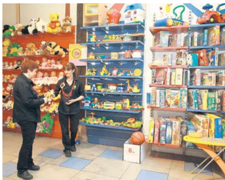
Rezikleta ha ampliado la recogida de ropa a otros productos como juguetes.

Así, en primer lugar se seleccionan aquellas que se pueden vender como de segunda mano. Esta ropa pasa por un cuidadoso proceso de higienización para poder volver a ser utilizado por otras personas