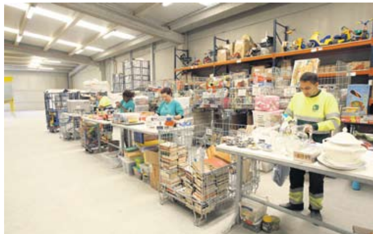
La nave tiene una superficie de 4.500 m 2 .