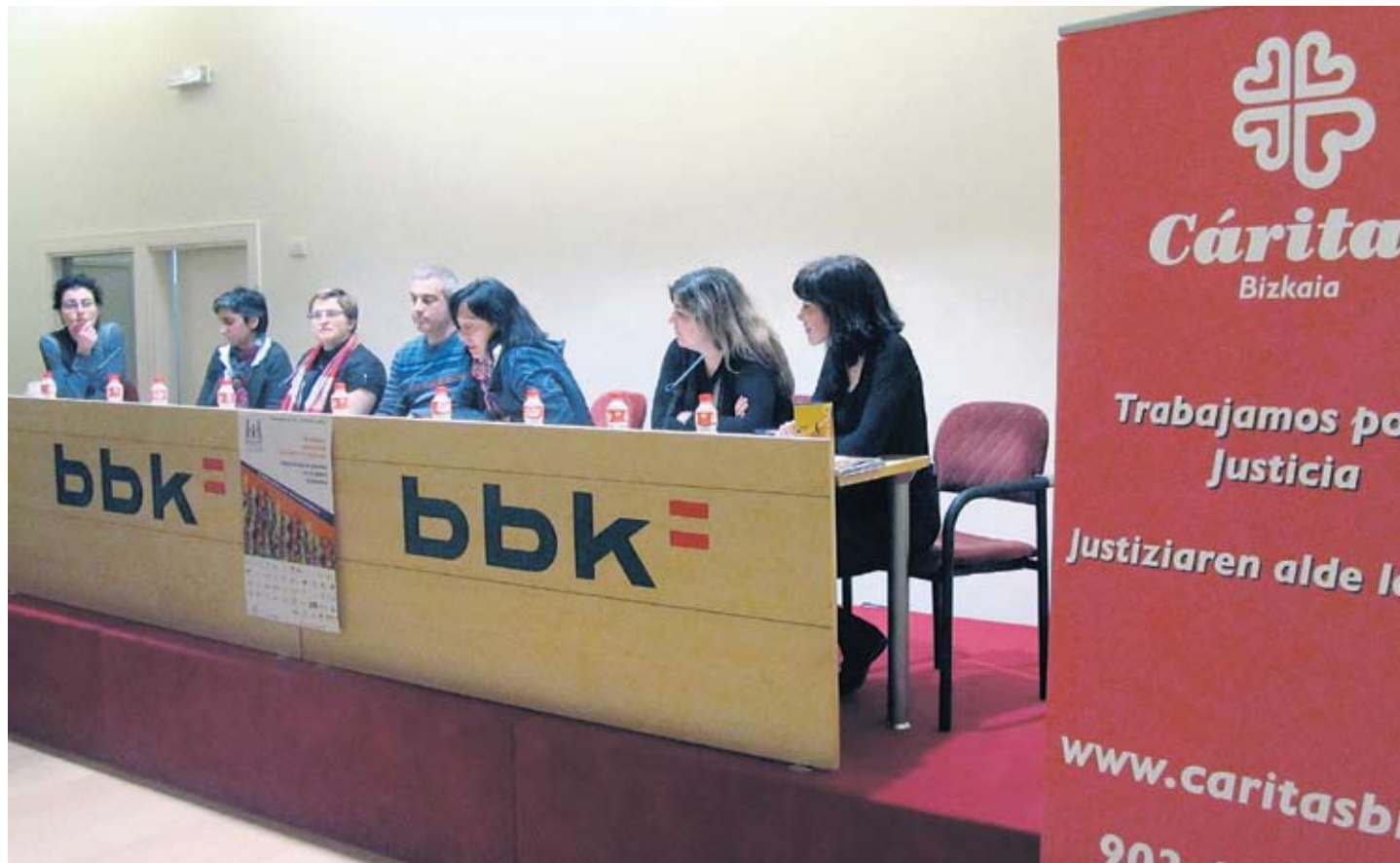
El acto se celebró en el aula de la BBK de Elcano dentro del programa del Foro para la Igualdad de Emakunde.