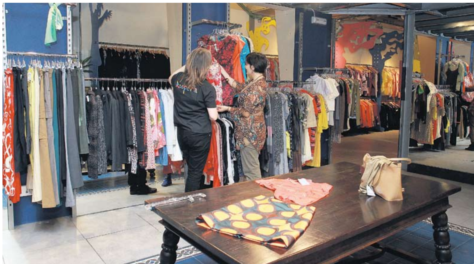
El reciclaje de ropa supone al año un ahorro de 1.344,22 toneladas de emisiones de CO 2 .

Bizkaiko hainbat herritan ikusten dira Kooperaren edukiontzia; horrek esan nahi du gizarteak gero eta konpromiso sendoagoa duela era guztietako materialak birziklatzearekin