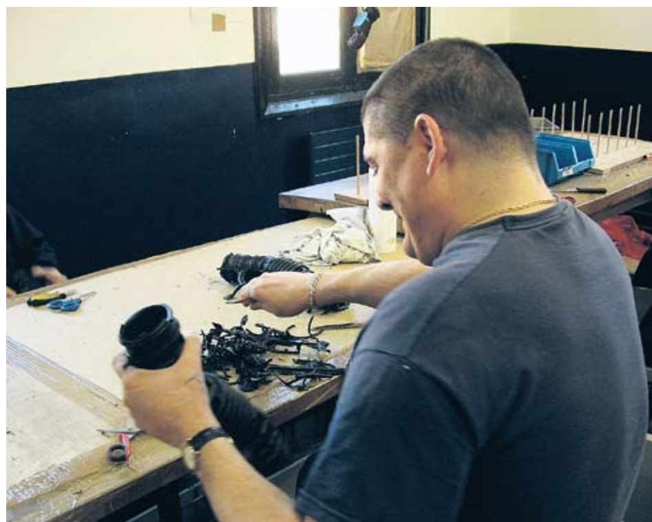
Bizkaiko Cáritasek apustu garbia egin du laneratzera bideratzeko.