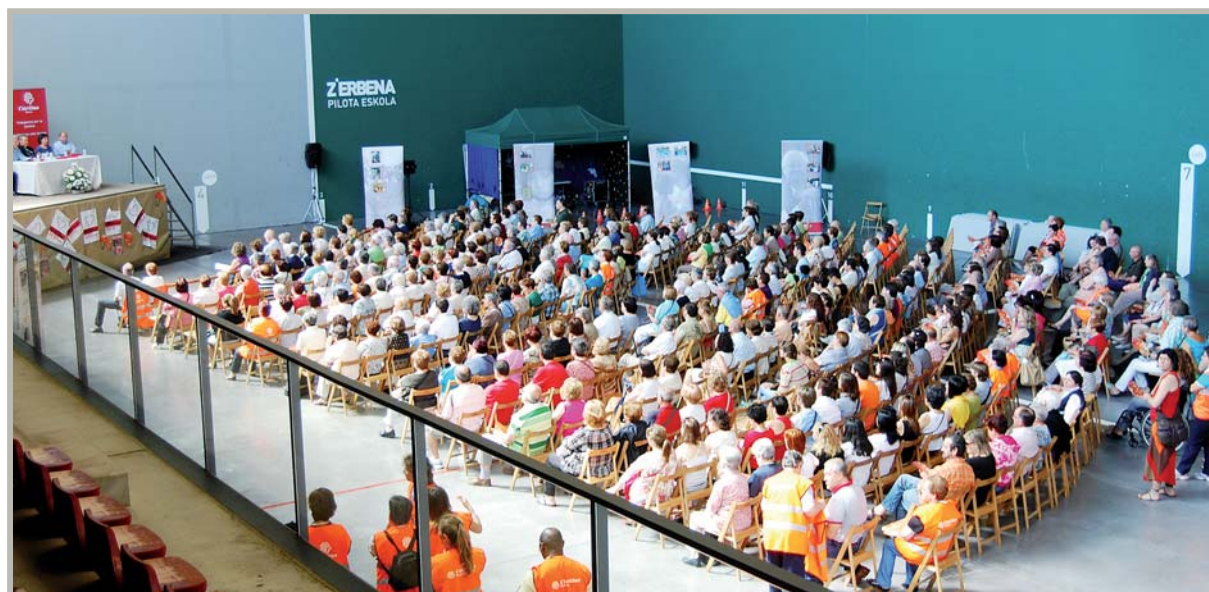
Más de 500 personas celebraron el 25 de junio en La Cuesta (Zierbena) el Día de la Caridad , con testimonios de personas voluntarias, una Eucaristía con el Obispo don Mario Iceta, una comida y actividades lúdicas.

«La consecuencia más directa que padecemos es el recorte de ayudas y beneficios sociales para las personas que peor lo