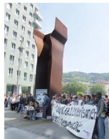
Concentración de BesteBi.

cio abandonado. «Las enfermedades crónicas y la dificultad para seguir tratamientos hacen que la esperanza de vida del colectivo de personas sin hogar sea muy inferior a la del resto de la sociedad», advirtieron desde esta agrupación de entidades que lucha por mejorar, precisamente, esta situación. «Desde BesteBi, consideramos imprescindible que seamos una sociedad acogedora, especialmente con quienes peor lo están pasando, con los más débiles y vulnerables. Este suceso vuelve a poner de manifiesto la situación de desprotección y vulnerabilidad en la que se encuentran las personas sin hogar, castigadas muchas veces por la falta de apoyos familiares, de rela-