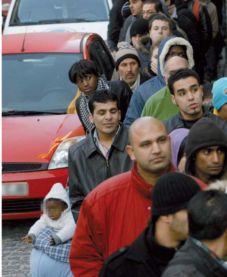
En caso de repatriación, debe primar el interés superior del menor.

No obstante, el nuevo reglamento también presenta aspectos negativos. Uno de los más importantes es que plantea la amenaza de que en un futuro se puede exigir que el contrato de trabajo se limite a alguna de las actividades de difícil cobertura que se aprueban trimestralmente, lo que equivaldría a cerrar prácticamente la vía de la regularización por arraigo social. A su vez, las cuantías que se exigen para reagrupar a una o varias