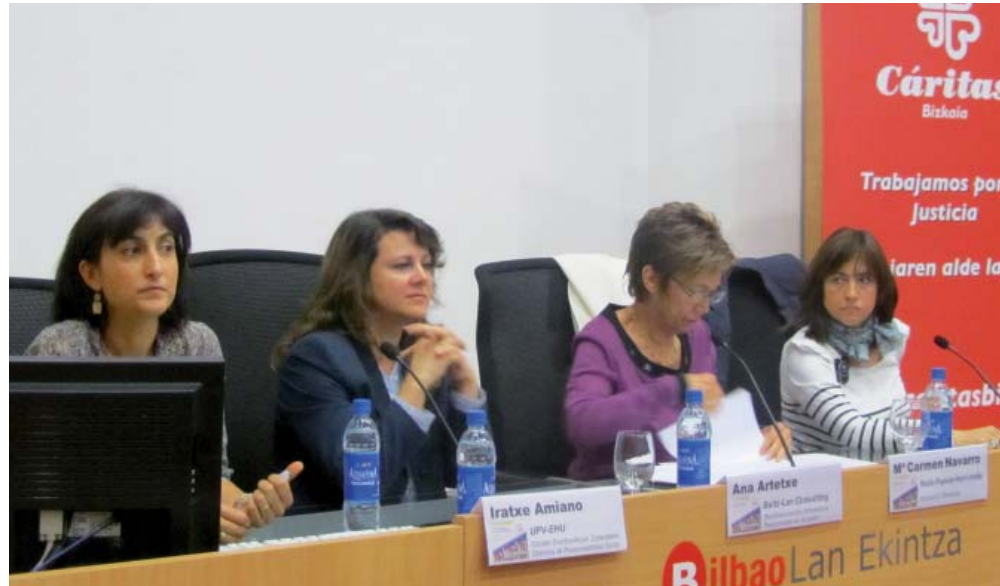
Las invitadas expusieron sus opiniones y contestaron a las preguntas del público.