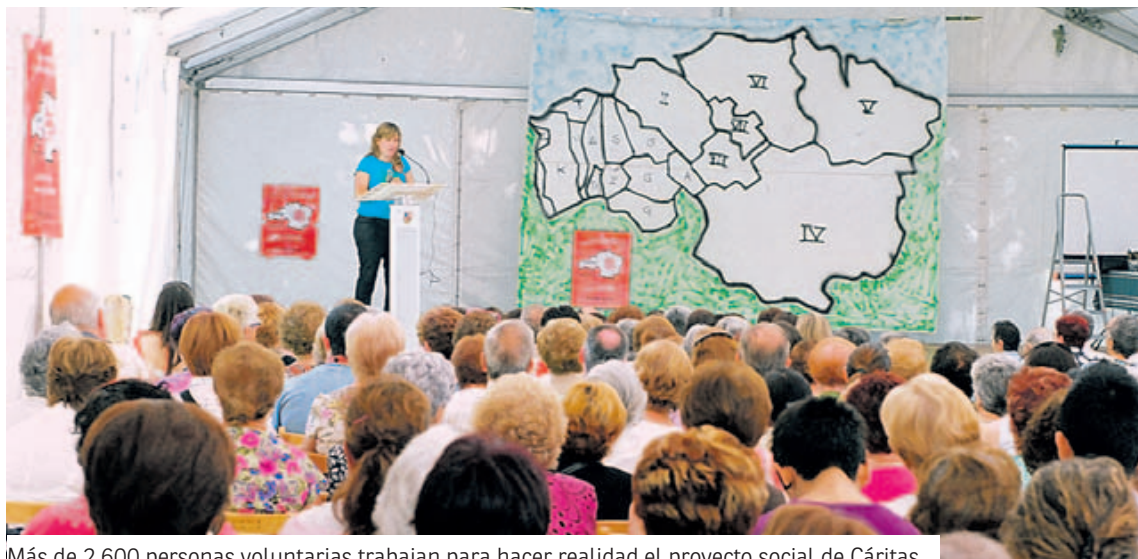
Más de 2.600 personas voluntarias trabajan para hacer realidad el proyecto social de Cáritas.

El voluntariado de Cáritas, con su dedicación, sus aportaciones y su ilusión, ayuda a concretar la apuesta firme de la Iglesia de Bizkaia por compartir camino y vida con las personas más débiles, dándoles voz y participación en nuestras comunidades y en nuestra sociedad. Cáritas es Iglesia y la Iglesia se expresa también a través de Cáritas.