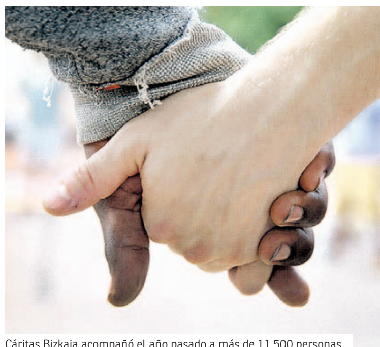
Cáritas Bizkaia acompañó el año pasado a más de 11.500 personas.

Otros programas numéricamente menores suponen procesos de incorporación social de larga duración o bien un trabajo de prevención y de acompañamiento de las personas mucho más sostenido en el tiempo, donde las cifras pasan a un segundo plano ante la intensidad de los acompañamientos. Aun así, conviene reseñar el ya mencionado de familia-inclusión social, infancia y mayores, que suman un total de 3.575 personas acompañadas.