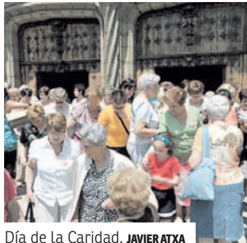
Día de la Caridad. JAVIERATXA

En 2014, Cáritas Bizkaia consiguió la estabilidad entre ingresos recibidos e inversión social: 12.412.309 euros, una cifra ligeramente superior a la de los dos ejercicios precedentes. Una de las fortalezas de la institución son las 5.000 personas socias y donantes que confían en Cáritas Bizkaia para encauzar su participación solidaria; una línea de apoyo que desde que comenzó la crisis ha ido aumentando significativamente.