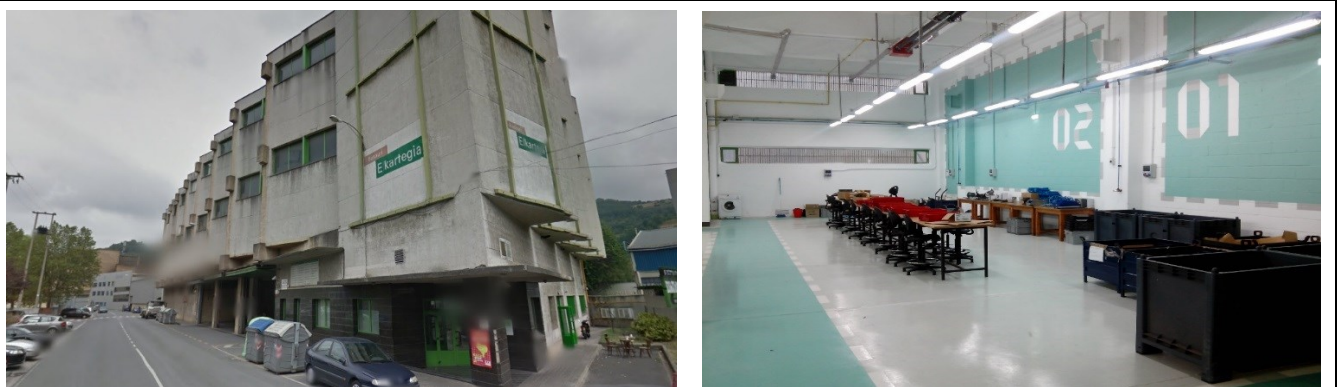
Centro Ariz de Cáritas Bizkaia - Elkartegia Basauri, módulo 17 - Avda. Cervantes, 49 – 48970-BASAURI - Tfn. 944024759

Se trata de una actividad en la que la persona adquiere y/o recupera hábitos y competencias sociolaborales a través de la actividad productiva en Taller (tareas manipulativas y de mecanizado); así, a través de tutorías, la persona es acompañada en la mejora de su empleabilidad posibilitando el desarrollo de una autoestima positiva, de un nivel motivacional creciente hacia el mundo del trabajo y de relaciones interpersonales adecuadas, así como su conocimiento de los recursos laborales y desarrollando su 'Plan personal de inserción laboral' con un objetivo definido y una planificación y seguimiento de su búsqueda activa de empleo.